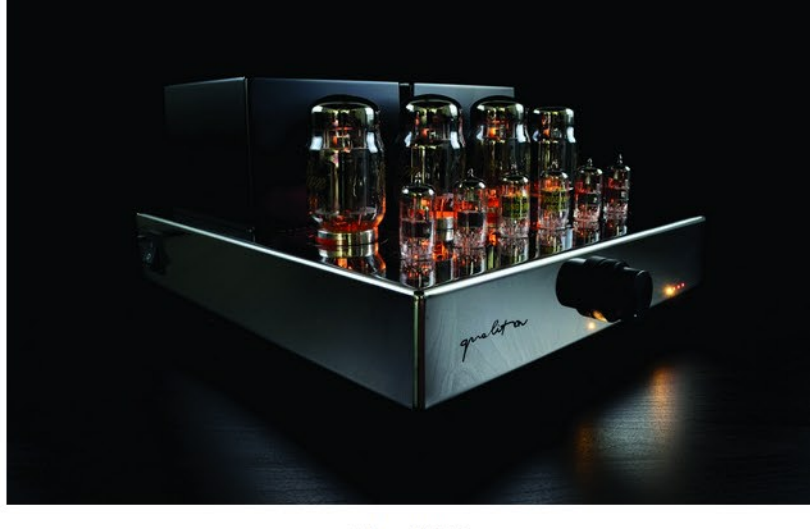
A legszebb kép!

A csövek első felizzása után körülbelül egy percet kell várni a szabad jelzés érkezéséig, amire egy szimmetrikus LED figyelmeztet a központi kapcsoló csoport bal alsó részénél. A gyönyörűen fényesre polírozott high-end távirányító csak a hangerőállításra és a némításra szolgál. Nehez és fémből van, de az alja borbortós, ezért nem koppan az asztalon, nem zökent ki a műelvezetből (figyelmes gondosság)!