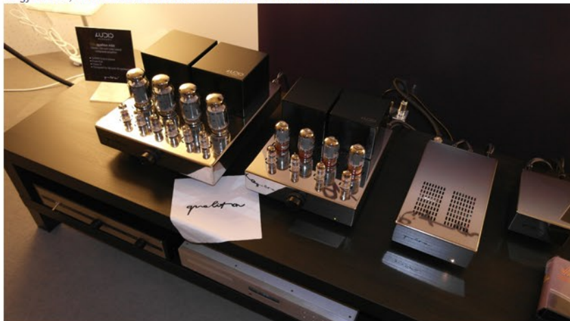
Az Audio-Hungary Qualiton flottája, köztük az új 100 Wattos erősítővel - lenyűgöző látvány.

Olvasóink a következő napokban több részletben kapnak majd beszámolót az eseményekről, és az újdonságokról, most csak egy örömnövénynek adunk kiemelt hangsúlyt, ez pedig az Audio Hungary müncheni megjelenése, akik a Halle 1 kiállítási csarnokban várták az érdeklődőket.