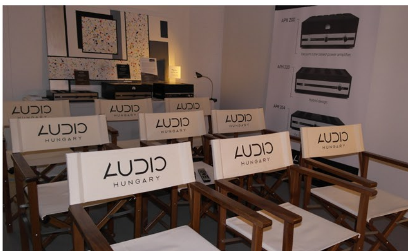
Az Audio Hungary hangulatos bemutató teremmel várja a látogatókat, és a kereskedelmi szakembereket a kiállításon

A nálunk is egyre népszerűbb, és már sorozatgyártás alatt lévő Qualiton High End erősítők mellett a cég felvonultatta a teljes készletet, és örömmünkre szolgált, hogy már az első nap is szépszámu érdeklődőt üdvözölhettek standjukon.