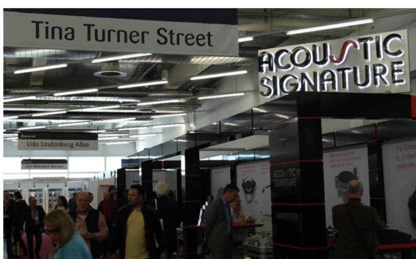
Megadja a kiállítás alaphangját, a nagy zenészekről elnevezett passzázsor, ahol a zenei világ ikonjai vannak megörökítve, köztük Liszt Ferenc neve is.

A kiállítás hangulatára jellemző, az általam már sokszor megcsodált, és a csarnokokban látható nagy zenészek nevével viselő passzázs elnevezés, ami a standok között vezető utcák felett látható. A több ezer kiállító - kicsik és nagyok - hihetetlen lendülettel és odaadással foglalkoznak az érdeklődőkkel, az egész jelenség kicsit bábéli képet nyújt, hiszen Európa és Amerika, sőt Oroszország gyártói vannak itt, ki-ki a saját nyelvén, és persze az angol nyelv egy nagyon speciális keverékén kommunikálnak egymással.